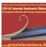
CCP-SC Arenula: Seminario Clinico Formazioni Cliniche del Campo lacaniano www.praxislacaniana.it

Seminario Clinico del Centro di Consultazione Psicoanalitica, CCP-Onlus