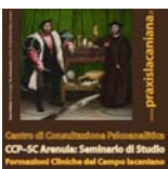
CCP-SC Arenula: Seminario di Studio Formazioni Cliniche del Campo lacaniano www.praxislacaniana.it

Seminario di Studio di Praxis-FCL in Italia, Forum del Campo lacaniano