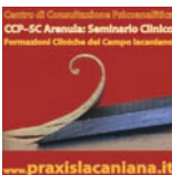
CCP-SC Arenula: Seminario Clinico Formazioni Cliniche del Campo lacaniano www.praxislacaniana.it

Seminario Clinico del Centro di Consultazione Psicoanalitica, CCP-Onlus