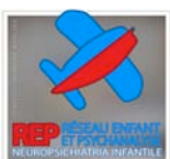
REP RESEAU ENFANT ET PSYCHANALYSE NEUROPSICHIATRIA INFANTILE www.praxislacaniana.it

In occasione della Conferenza sarà presentato: L'inconscio, che cos'è? , Colette Soler, Quaderno di Praxis n° 8