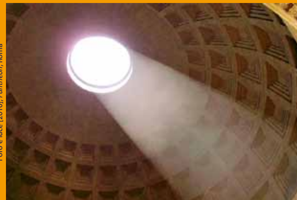
Foro e luce [2010], Pantheon, Roma