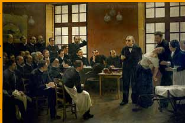
Une Leçon Clinique à la Salpêtrière [1887], André Brouillet, Paris