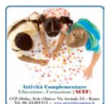
Attività Complementare Educativa, Formativa (MEE) CCP-Onlus, Sede Clinica Via Arenula 53 - Roma Tel. 06 45481515 - www.praxislacaniana.it

Seminario AC-ACEF del Centro di Consultazione Psicoanalitica, CCP-Onlus