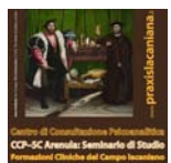
Centro di Consultazione Psicoanalitica CCP-SC Arenula: Seminario di Studio Formazioni Cliniche del Campo lacanianiano www.praxislacaniana.it

Seminario di Studio di Praxis-FCL in Italia, Forum del Campo lacanianiano