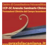
Centro di Consultazione Psicoanalitica CCP-SC Arenula: Seminario Clinico Formazioni Cliniche del Campo lacanianiano www.praxislacaniana.it

Seminario Clinico del Centro di Consultazione Psicoanalitica, CCP-Onlus