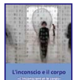
L'inconscio e il corpo Il Seminario di Praxis

Collegio di Clinica Psicoanalitica Onlus , Spazio clinico di Praxis-FCL in Italia